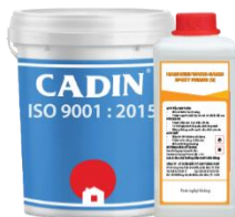
Bộ/5Kg (4Kg A và 1Kg B)