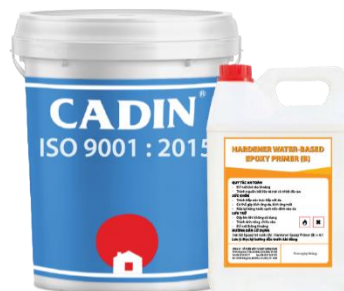
Bộ/20Kg (16Kg A và 4Kg B)

Tồn trữ nơi mát mẻ khô ráo. Tránh nguồn nhiệt và lửa.