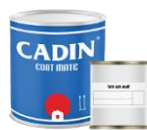
Bộ/1Kg (0.8Kg A và 0.2Kg B)

Sản phẩm được đóng gói trong lon/thùng sắt: