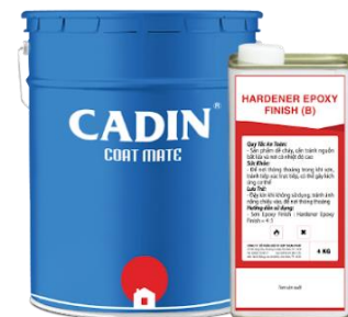
Bộ/20Kg (16Kg A và 4Kg B)

Tồn trữ nơi mát mẻ khô ráo. Tránh nguồn nhiệt và lửa.