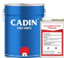
Bộ/5Kg (4Kg A và 1Kg B)